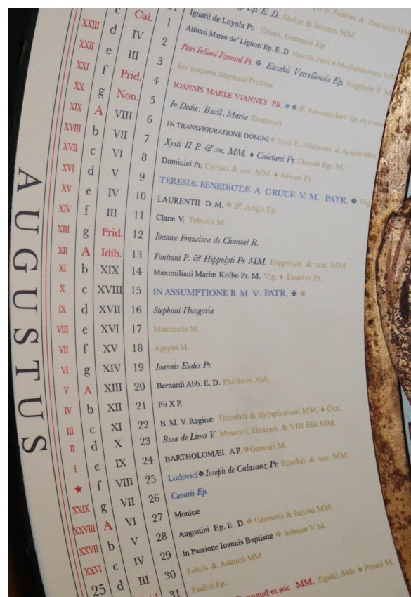
FIGURE 5 – Comparaison du mois d'août dans l'ancien (à gauche) et le nouveau (à droite) calendrier.