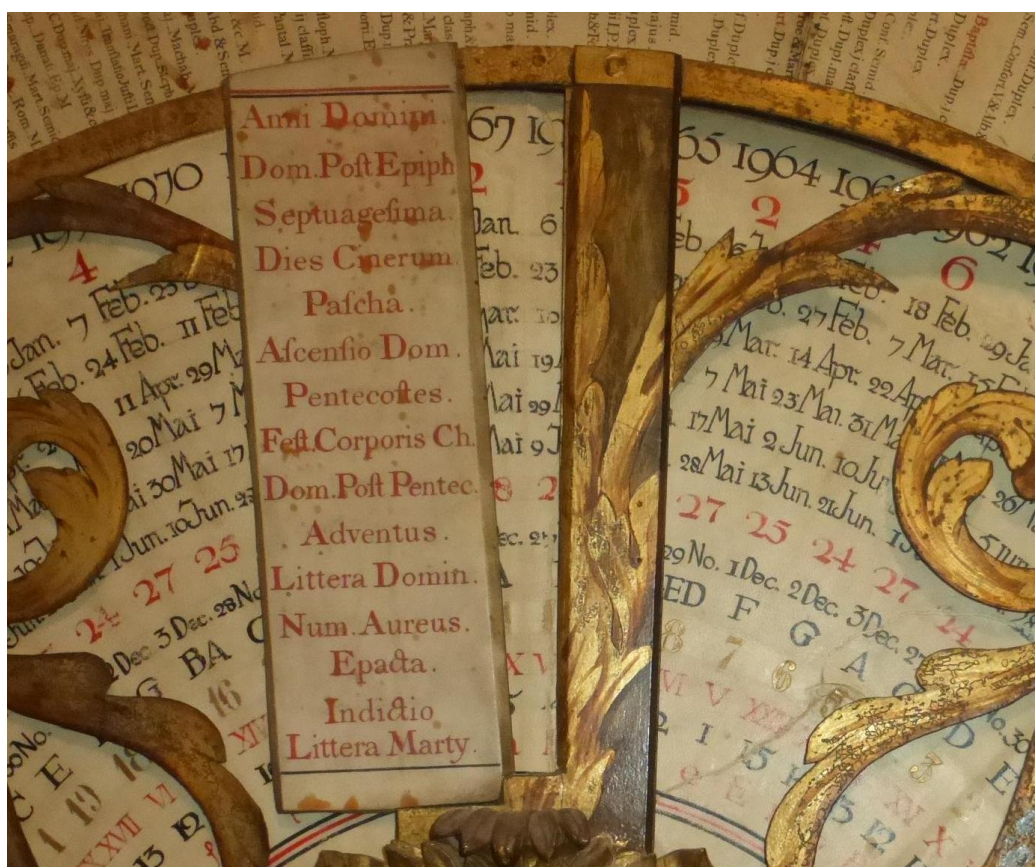
FIGURE 2 – Détail de l’anneau intérieur de 1954-2019, ici mal positionné (photographie de 2023).