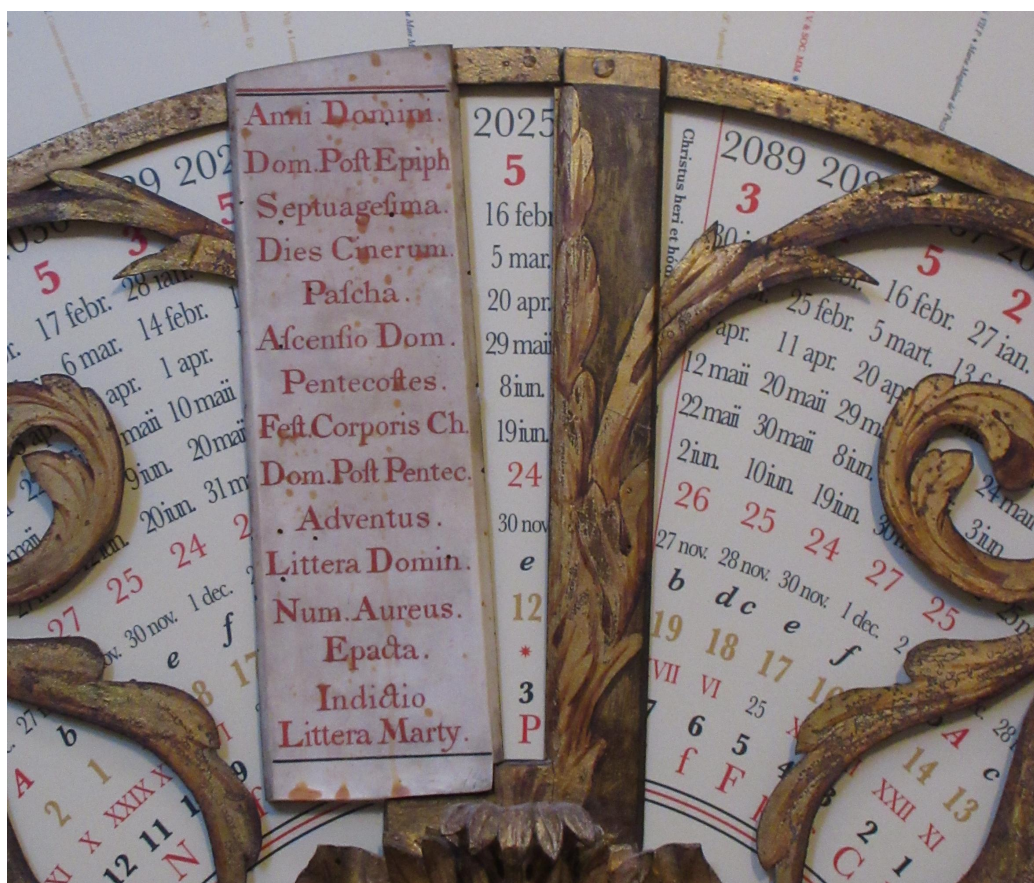
FIGURE 3 – Détail de l'anneau des fêtes mobiles du nouveau calendrier.

Même si la forme générale de l'anneau de 1954 a été conservée, et que le nouvel anneau reste lisible, on peut néanmoins noter un certain nombre de différences. On peut notamment regretter que le style des chiffres ait été changé, ou encore que la lettre dominicale ne soit pas indiquée en majuscules.